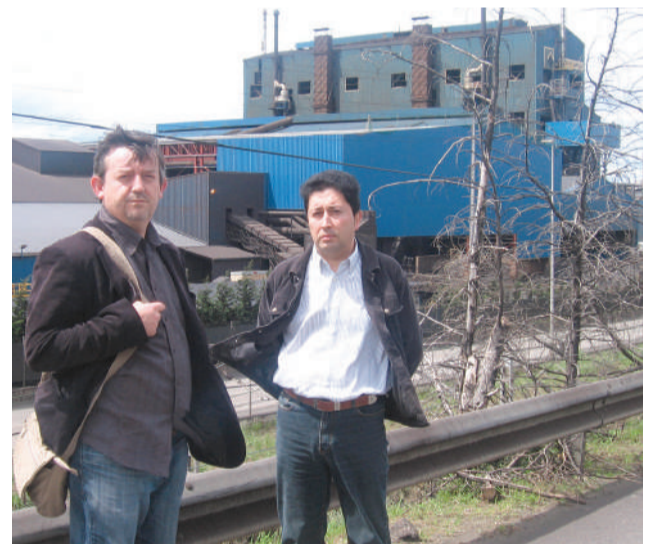
Presidentes de la Asociación de Vecinos y de la Junta Vecinal de Maliaño.

No se ve demasiado claro el futuro industrial de Cantabria, peor se va a poner si lo que pretenden las empresas es que el futuro Gobierno Español hipoteque sus compromisos internacionales y sus objetivos de futuro para seguir subvencionando lo privado aunque esto atente también contra sus propios vecinos. El mundo camina hacia la no contaminación y Ferroatlántica si quiere sobrevivir tendrá que adaptarse y cumplir como si fabricara "pan".