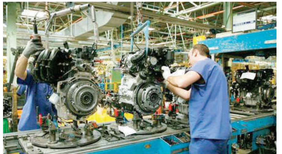
Trabajadores de la industria de la automoción.

En este sentido, Conde pone el foco en la necesidad de llegar a "pactos transversales" para que "la incertidumbre de los cambios de gobierno no se traslade a las inversiones", así como en "plantear la transición al coche eléctrico de manera asumible y que todos conozcamos los pasos". "Las recetas no son mágicas, no se va a solucionar de la noche a la mañana, pero hay que dar pasos en la buena dirección", concluye el representante de CCOO.